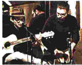
PREMIO In palio la pubblicazione

Gli artisti selezionati avranno la possibilità di esibirsi nelle cinque serate eliminatorie (27 settembre, 4-11-18-25 ottobre) che daranno l'accesso alle due semifinali l'8 e il 15 novembre, nel corso delle quali verranno scelti gli 8 partecipanti alla finale del 29 novembre. Le eliminatorie si terranno nel locale milanese Ronchi 78. Il vincitore oltre a ricevere un premio in denaro, avrà la possibilità di avere come editori Palbertmusic s.a.s. e Bollettino Edizioni Musicali s.r.l. per i due brani proposti in finale.