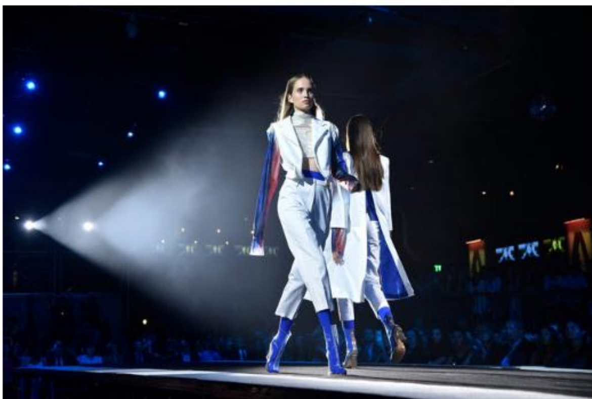
Un momento della sfilata del "Secoli Fashion Show 2018"

La storica scuola milanese di modellistica, Istituto Secoli, ha rivelato i nomi delle giovani promesse di moda durante il "Secoli Fashion Show 2018". Al termine della sfilata andata in scena negli spazi dell'Alcatraz di Milano il 7 giugno scorso, con la partecipazione di più di 50 designer per oltre 100 outfit presentati, sono stati premiati i talenti più meritevoli dell'Istituto.