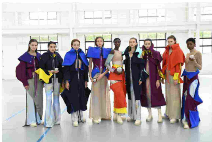
SECOLI Fashion Show 2021

Tema di ispirazione della sfilata il concetto GE.NE.RA : studio dell'evoluzione del mondo digitale e virtuale attraverso l'arte, il contenuto video, la musica, le piattaforme social, la fotografia. Un compromesso tra vecchio e nuovo che "genera" un nuovo pensiero attraverso un viaggio temporale che inizia dall'era post-moderna, attraversando il contemporaneo, fino alla definizione di un'epoca post-contemporanea.